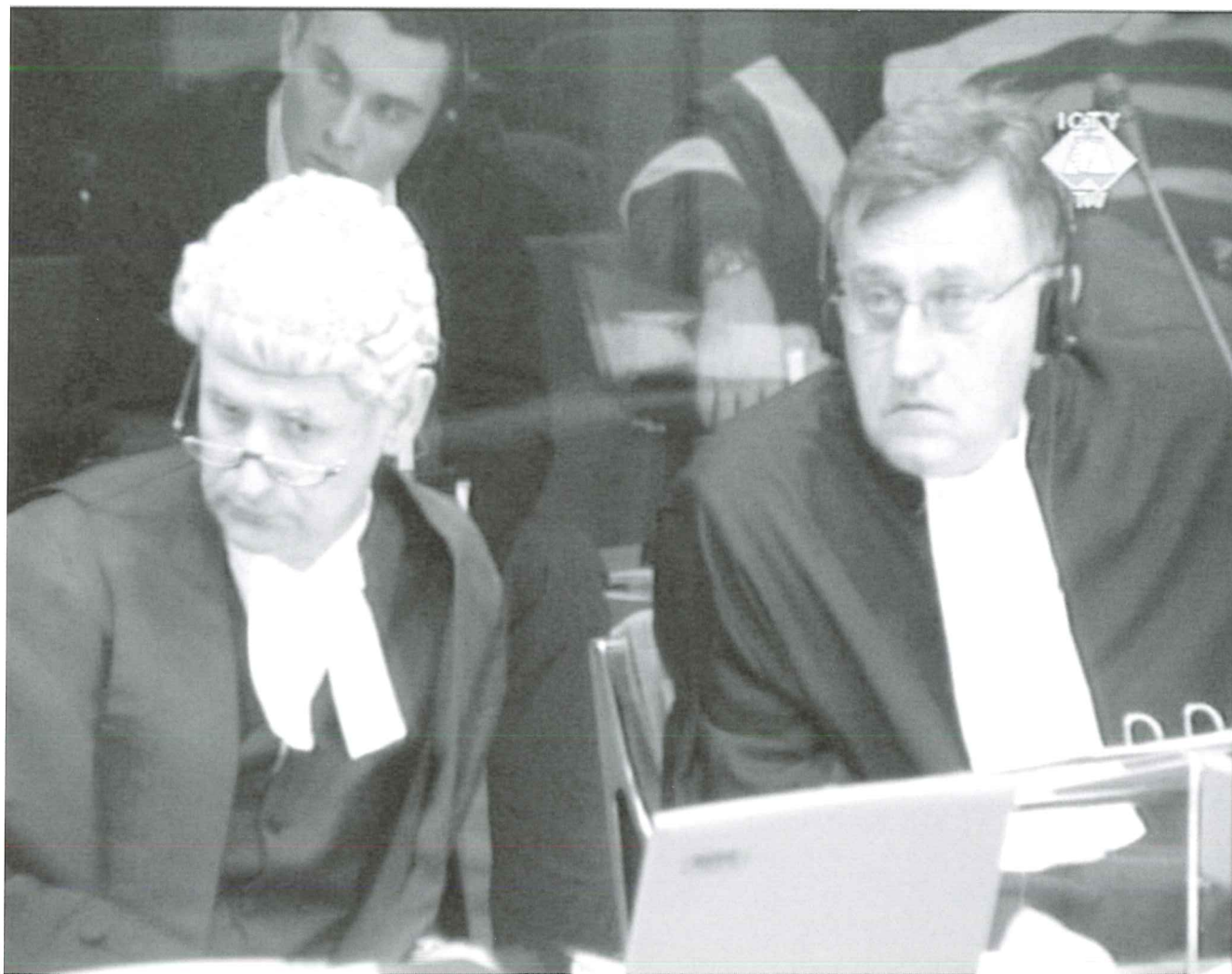
Behind the Amici II