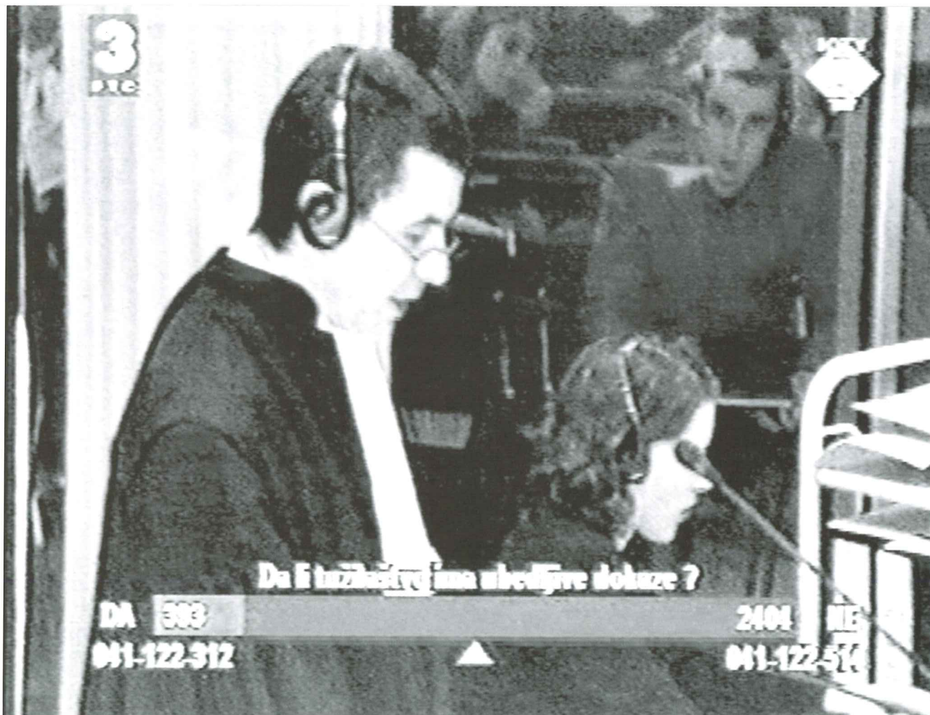
Behind the prosecutor