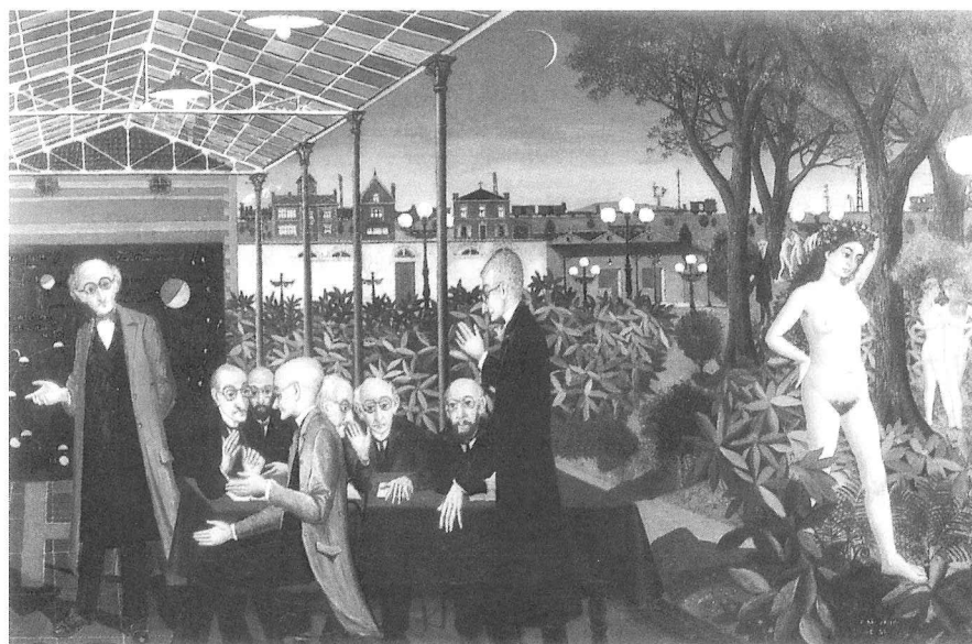
Paul Delvaux, de school der geleerden , 1958, olieverf op doek, origineel in kleur