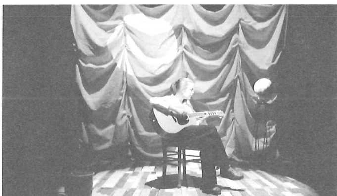
Bloetverlies STEF LERNOUS/ABATTOIR FERME