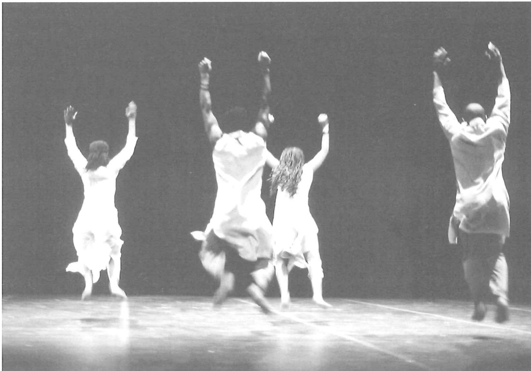
Act One/Acto um ARCO RENZ i.k.v. alma txina (a soul for dance) CULTURARTE & DANÇAS NA CIDADE