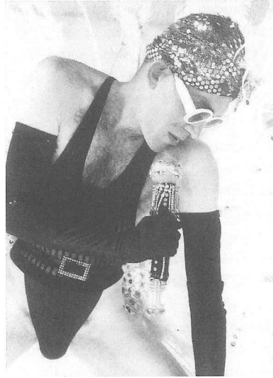
Hommages -Under My Skin (Mark Tompkins / Cie IDA,1996)