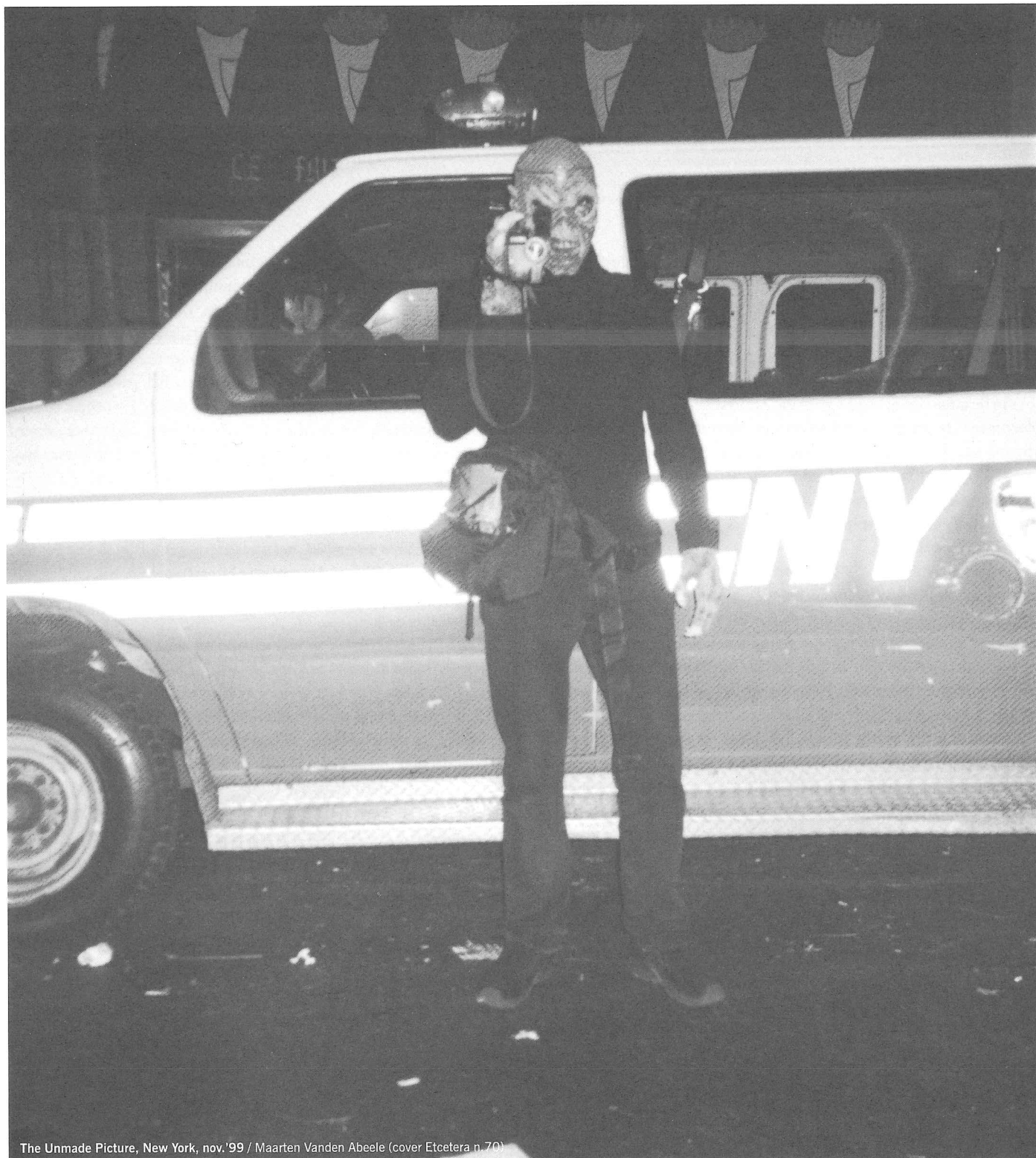
The Unmade Picture, New York, nov.'99 / Maarten Vanden Abeele (cover Etcetera n. 70)

Onze coverfotograaf Maarten Vanden Abeele opent het thema met een beeldende reflectie over beeld en geheugen.