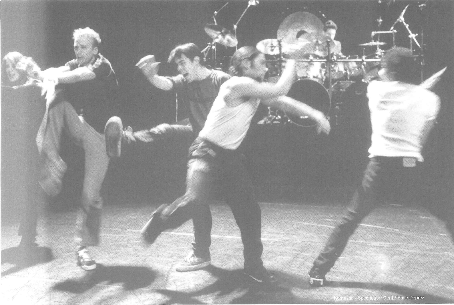
Komesha - Speeltheater Gent