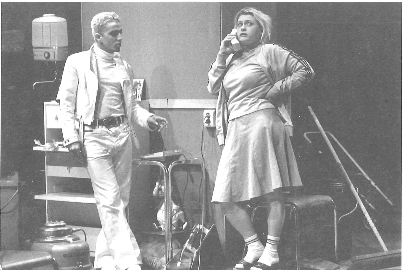
Moeder en kind, Victoria

Pauwels: 'Als je ziet hoe vaak in het circuit van de gekende gezelschappen voorstellingen afgelast worden, niet doorgaan, of wel doorgaan, maar dan saai zijn. Dat is dus theater. Het verschil is, als je je kwetsbaar opstelt, krijg je het stigma: dat is kennelijk een organisatie die mag mislukken. Dat is totaal verkeerd. Je mag niet mislukken, omdat het noch voor het