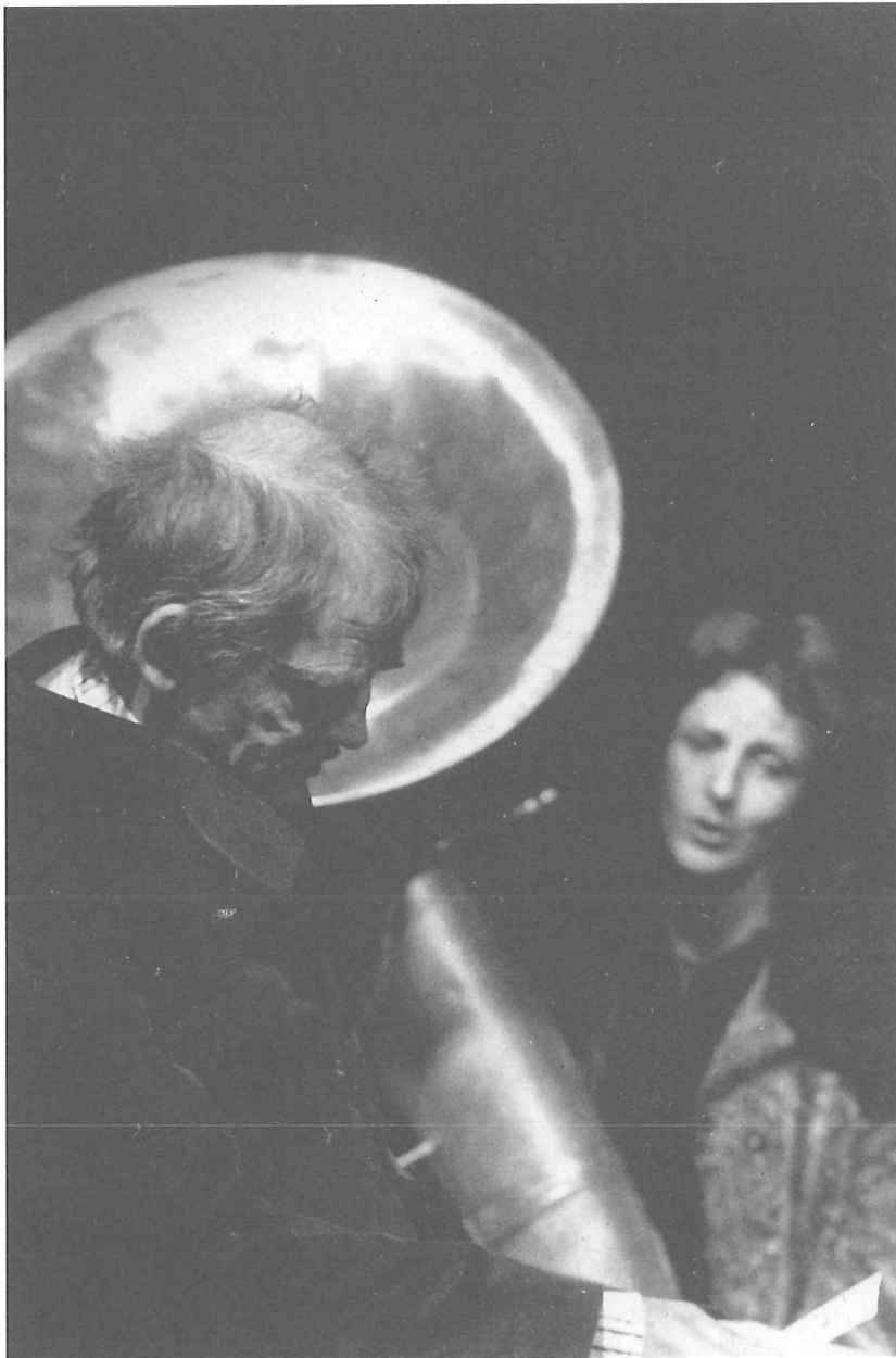
De vuurvogel, Het Muziek Lod / Philippe Digneffe

Guy Cassiers zowel de tekst (reciterend of zingend) als de diaprojectoren. Het is de meest 'klassieke' productie van Lod omwille van het gevonden vergelijk tussen tekst, vorm en muziek.