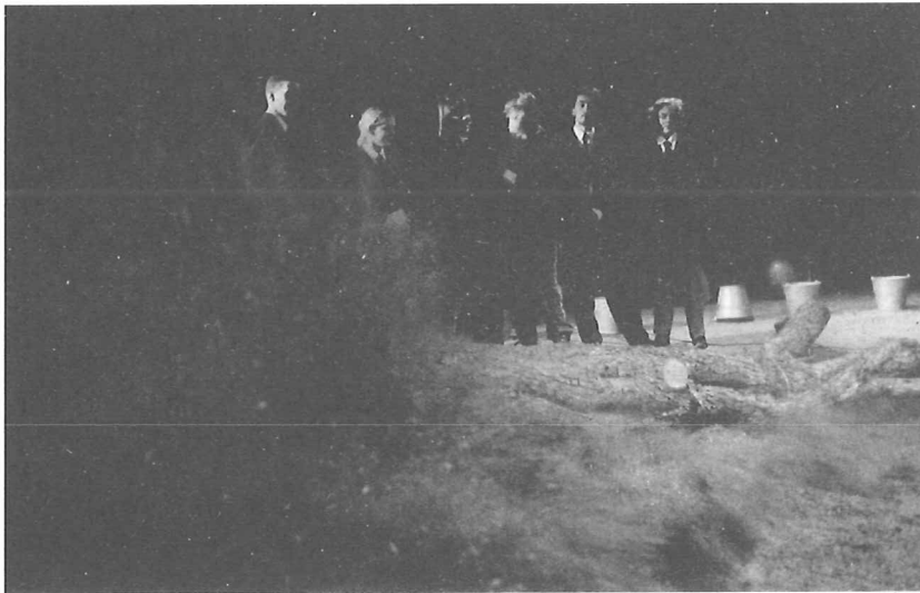
Allons les gars