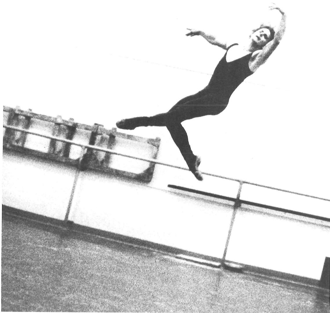
Max Waldman, Baryshnikov in repetitie, 1975

De ruimte-energie is niet klinisch gelay-out in een scherpgesteld beeld; integendeel de energie heeft zich als een wisselstroom tussen het lichaam van de danser en dat van de fotograaf ontladen in een subliem onwaarschijnlijk beeld.