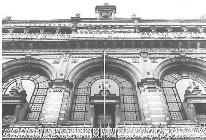
Koninklijke Vlaamse Schouwburg