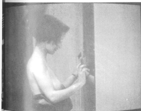
Het gebruik van de spiegel: narcisme en een identiteitsspel