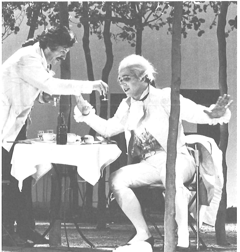
La Finta Giardiniera

In de zaal, die ooit een opslagplaats moet geweest zijn, staat een podium opgebouwd met daarop een "facsimile" van het uiteindelijke decor. De bomen zijn van plastic, de scène-opening met de zitbank en het bronnetje is nagemaakt in hout. De verzinking rond het standbeeld en het waterbassin zijn in witte lijnen op de vloer aangegeven. Vóór het podium een clavecimbel en een piano voor de begeleiding, wat stoelen en een paar tafels, met daarop her en der verspreid prenten- en fotoboeken, partituren en een paar rekwisieten. Aan de muur veel foto's, prenten en schetsen. In een hoek staat een mooie maquette van het decor, bevolkt met plaasteren figuurtjes. Een repetitie-sessie (drie