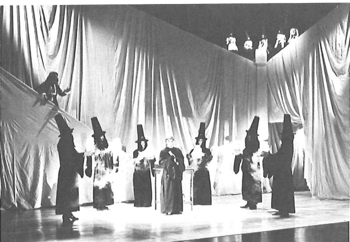
De Ingebeelde Zieke (NTG)