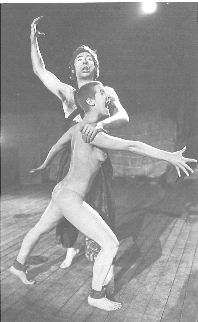
Rode oogst (De Sluipende Armoede)

De auteur hanteert de verheven taal van klassieke koningsdrama's, hier en daar geïroniseerd. De dialogen zijn gecomprimeerd en Sierens geeft blijk van een sterk poëtisch vermogen. Slechts twee voorbeeldjes. Bij de aanvang van het stuk vertelt de machthebber aan zijn minister: