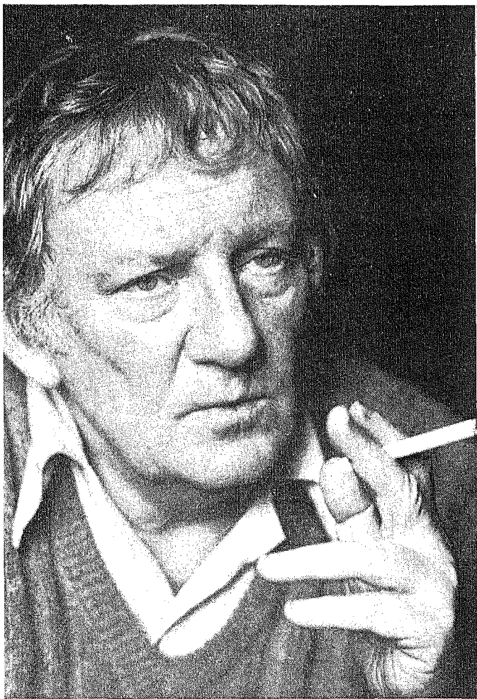
In de literatuur zit geen wetmatigheid.

een film die met eigen middelen wordt gedraaid en waarvan het scenario van een ander is?