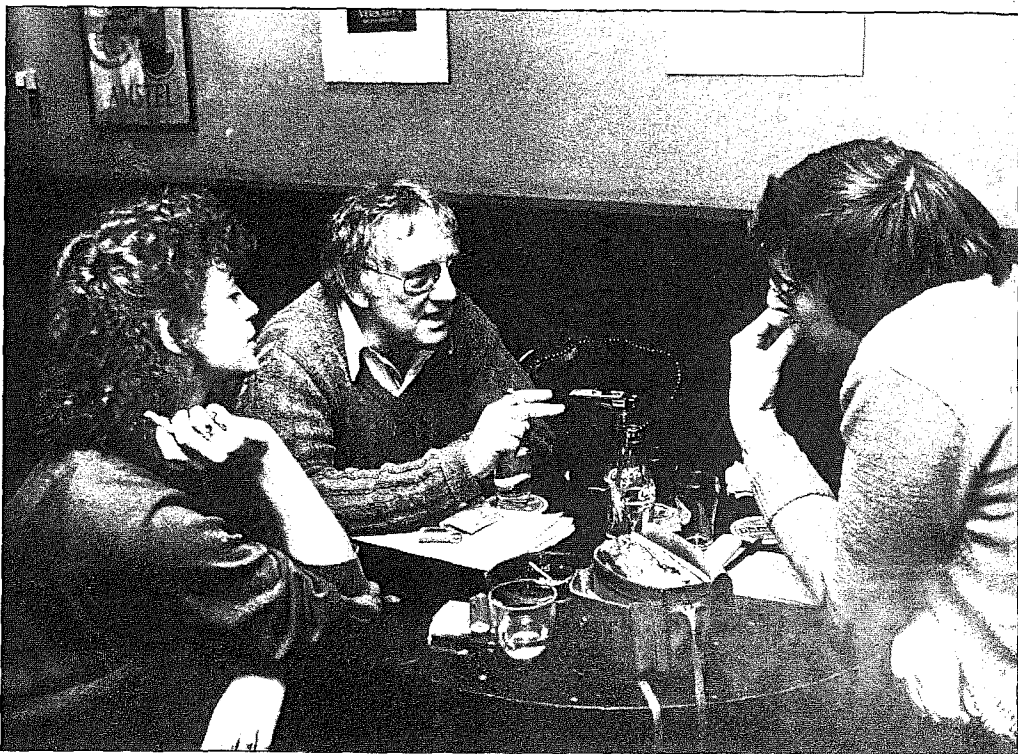
De werkomstandigheden voor een toneelacteur zijn in Vlaanderen werkelijk vernederend.

Vandaar dat er zo weinig professionele toneelschrijvers zijn. De werkomstandigheden zijn voor een auteur werkelijk vernederend. Zelfs honend. Het is toch zonde dat er bij elke nieuwe regering die tot stand komt — dat zijn er de jongste tijd behoorlijk wat — nooit een woord over cultuur valt.