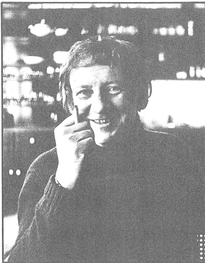
Hugo Claus over zijn breuk met Sylvia Kristel : « Als ik breek is het definitief. Ik ben niet koud en afstandelijk, maar ik kan het makkelijk zijn. IJskoud en onaantastbaar, als het moet. »

Waarom men vrouwen verkracht, ik bedoel wat de bijzondere spanning daarvan kan zijn heb ik nooit begrepen. Maar zelf