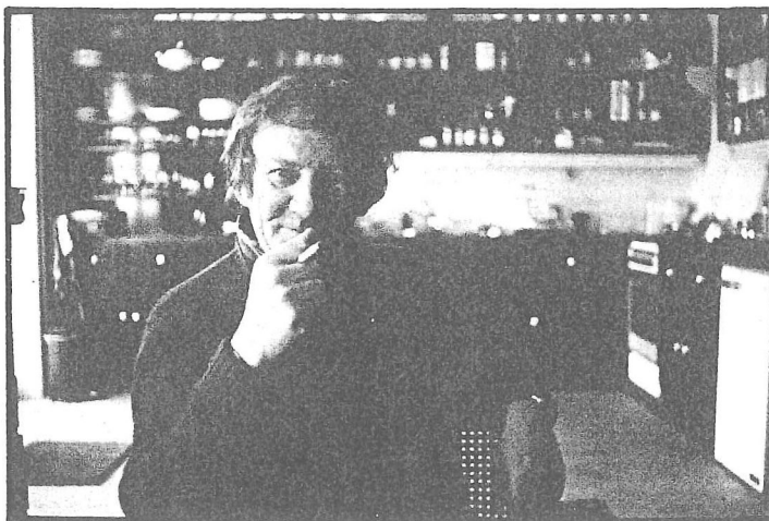
« Bepaalde vrouwen hebben de aantrekkingskracht van een moeras. »

Om die "Telegraaf"-kwestie hebben vrienden met mij gebroken. Reinbert de Leeuw bijvoorbeeld, heeft mij de vriendschap opgezegd. Hij zou zijn "Abschied" aan mij opdragen. Heeft dat toen niet gedaan Harry (Mullisch)? Die heeft zich gedistancieerd. Heel chique. "Nou, ik blijf toch met hem tennissen", zei hij. Peter Schat zeurt er nu nog over. "Ja... toch vind ik..." zegt hij dan. Hahaha. Ik vind het zeer leerzaam. Ik weet dat ik in geval van nood niet bij bepaalde mensen moet aankloppen. Ik heb ook nooit de minste behoefte om bij iemand aan te kloppen.