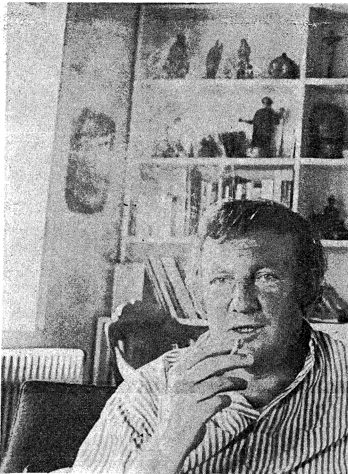
Nukerke pastoor over Claus. « Ik wil geen oordeel vellen. »

« Ik doe precies waar ik zin in heb. Dit proces zal me er niet kunnen toe dwingen me van eender welke aktiviteit te onthou-