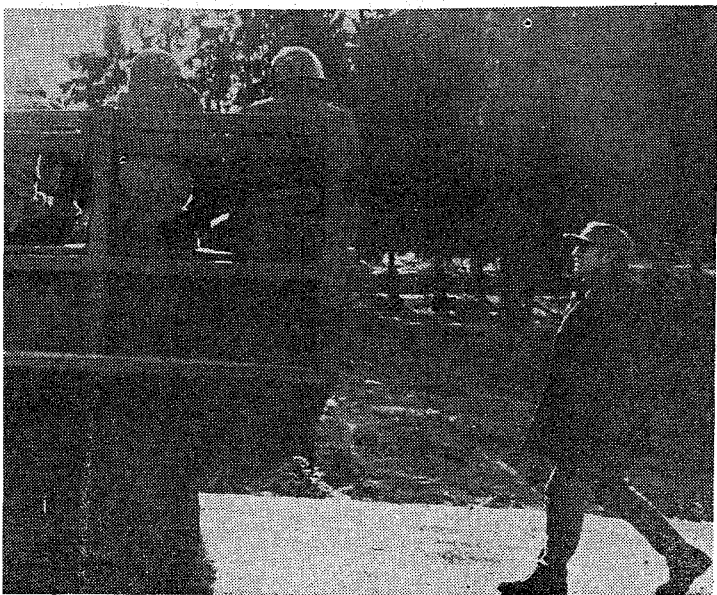
Claus flint « De vijanden » : « Drie naakte mannen tonen verzinkt in het niet bij de concentratie- kampen in Angola ».