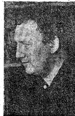
Hoe verklaart u dat? ● Dat komt omdat de Neder-

lustreet meteen wat de Vlamingen lezen. Wat mij betreft, is het zo dat ik nog steeds het best verkoop in Nederland. In procenten uitgedrukt is dat voor Nederland 80 en voor Vlaanderen 20. Tot voor een jaar was die verhouding 95 - 5.