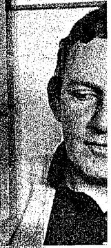
van de foto? Cl