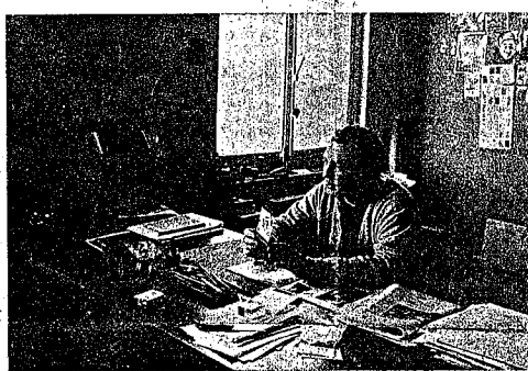
Claus laat het door hemzelf ontworpen omslag zien voor zijn nieuwe roman „De verwondering".

... en in het tweede bedrijf zitten de koning van Frankrijk, de hertog van Vlaanderen en de paus samen in een boom."