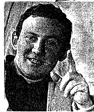
...maar niet als de gulle, hartelijke Vlaamse Reus, die hij ten slotte óók is.