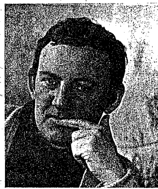
Zo wil hij wel, peinzend, lijdend, de ernstige dichter...